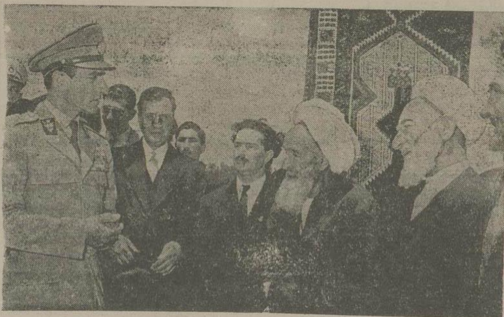
شاهنشاه دژ نزدیک دروازه شهرسراب هنگام عبور از برابرف مستقیم و ابراز تفقد نسبت با آقایان روحانیون

تشریف فرمائی شاهنشاه به بندر پهلوی اعلیحضرت همایونی در شرفیابی رؤسای ایلات شاهسون و اردبیل و اکراد خلخال فرمودند فرزندان خود را برای تحصیل طب و کشاورزی آماده نمایند تا در بهداشت و بهبود وضع فلاحت شادمانانه اقدام کنند مراسم رژه تپ مستقل و افراد عساکر و ورزشکاران اردبیل دیروز عصر در پیشگاه ملکات برقرار گردید