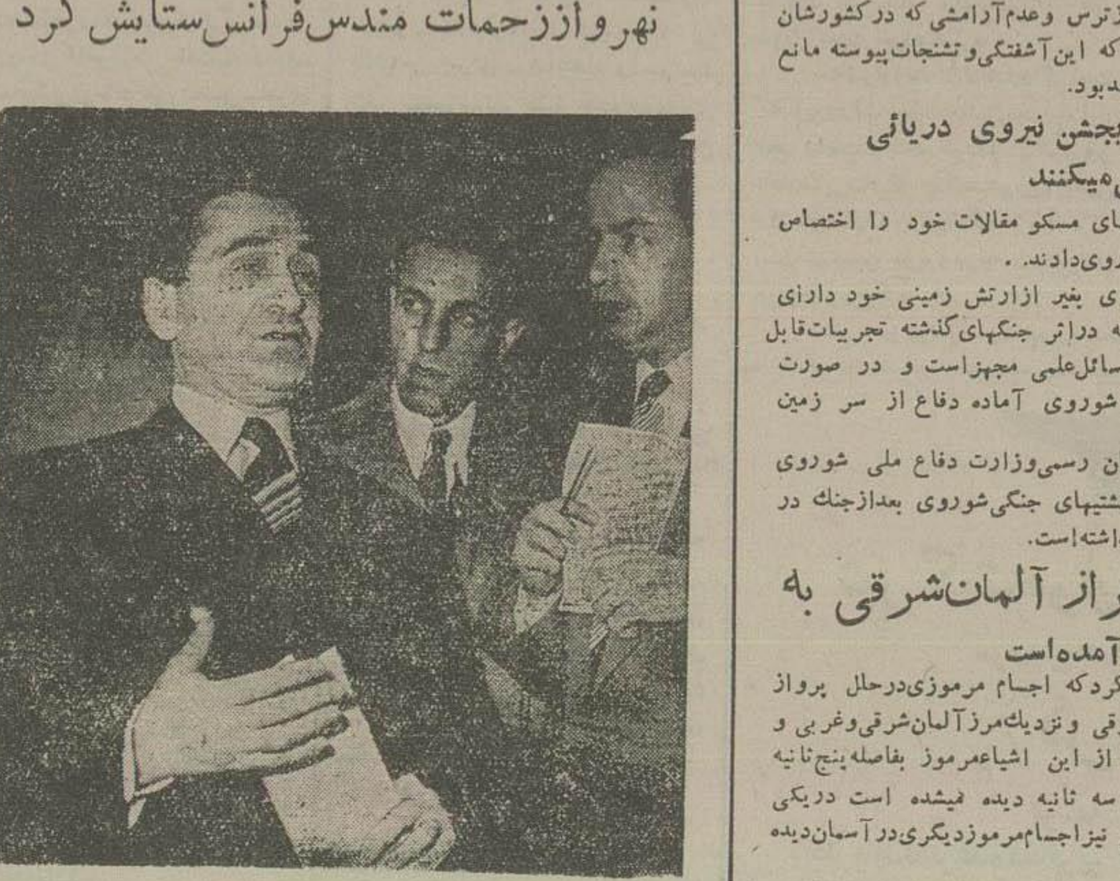
مهندس فرانس هنگام خروج از پارلمان در میان روزنامه نگاران

دهلی - نهر وازرحمت موقت کنفرانس ژنوطی نطق دیروز خود در برابر حزب کنگره پس از ستایش از زحمات مهندس فرانس نخست وزیر فرانسه گفت دولت هند درباره مناطق تحت نفوذ فرانسه در هند با این کشور اختلافاتی دارد و دولت فرانسه در افریقا و سایر نقاط جهان مشکلاتی برای حفظ مستعمرات خود شده است ولی آنکه مربوط به کنفرانس ژنوت است باید از همان نمود که مانع فرانس با شجاعت و شجاعت بی نظیری بعمل نشیمنان هندوچین موفق گردید و باید امیدوار بود که فرانس برای حل مشکلات سایر مستعمرات خود نیز از گوش و مجاهدت خودداری نخواهد کرد. نهر وازرحمت اشاره ب مسئله هندوچین نموده گفت اگر کنفرانس ژنوت موفق بعمل هندوچین نیگردد چنگ در این منطقه نه تنها ادامه می یابد بلکه سایر نقاط نیز سیرایت نموده و ممکن بود سلاحهای اتی نیز مورد استفاده قرار گیرد و بدین طریق دنیا بسوی نیستی واضعلال سوخته داده میشود.