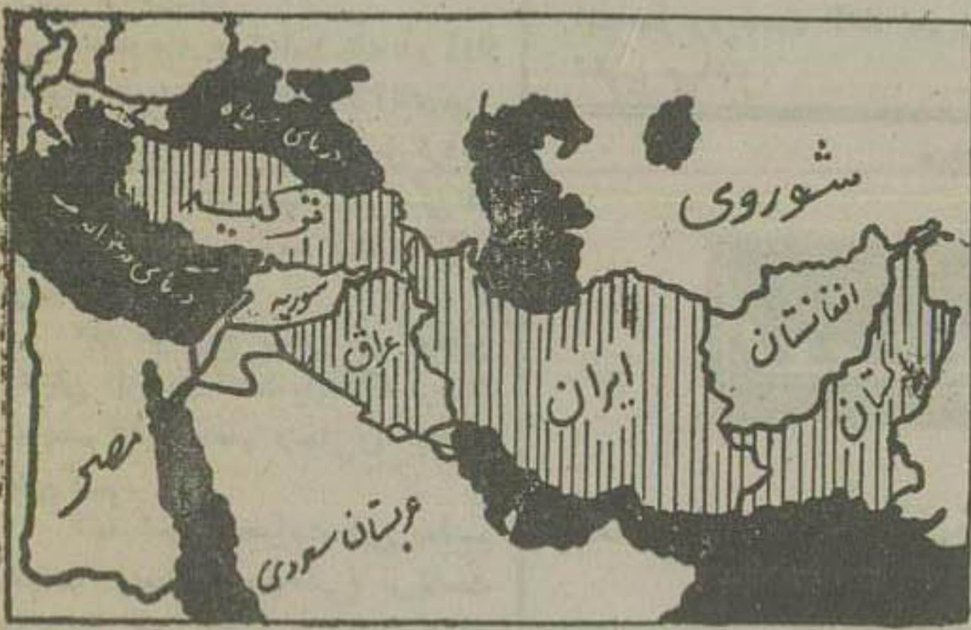
ایران و کشورهای خاور میانه

وزیر کیه ملحق میشود؟ نتیجه کنفرانس بانو کله