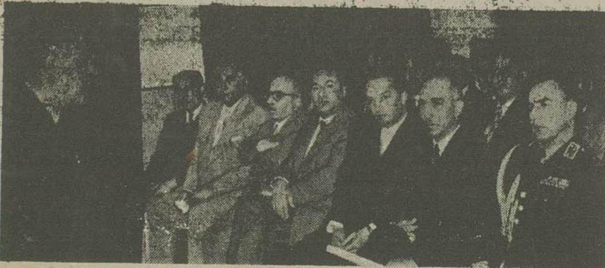
در عکس بالا آقای مهندس حامی معاون وزارت راه هنگام ایراد نطق در برابر آقای سر لشکر ولی انصاری وزیر معارف و روستای مستنهای مختلف وزارت راه دیده میشوند شرح در صفحه چهارم

اساسی کشور و تعمیر بنادر و اسکله ها برنامه وزارت راه می باشد کلیه مأمورین وزارت راه راه آهن بایستی در آیه فقط بکار و فعالیت خود اتکا داشته باشند