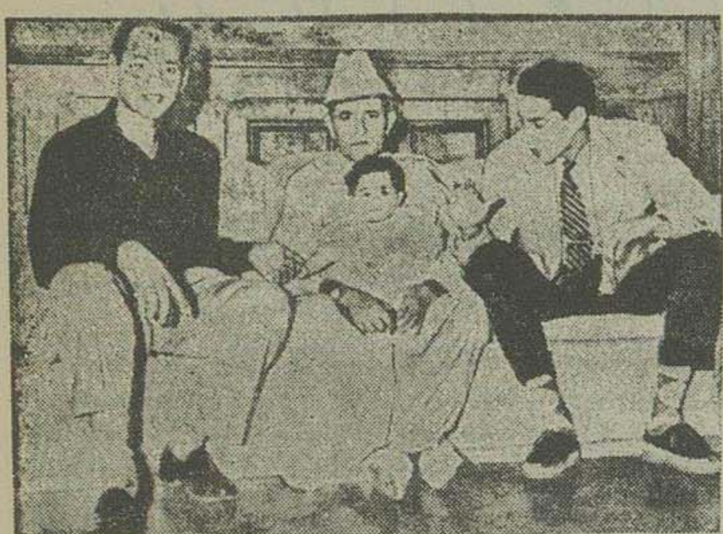
آخرین عکس سلطان با فرزند بزرگ خود و دختر کوچکش بر داشته شده است. سلطان با فرزند بزرگ خود و دختر کوچکش شاهزاده خانم آینه دیده میشود.

محل اقامت برون هنوز معلوم نشده و درباره وی شایعات زیادی منتشر گردیده است اسامی برون و همسرش او برون از وی دو ایالت آرژانتین برداشته شد مجسمه ها و عکسهای برون و همسرش در سه شهرهای آرژانتین منهدم شد کلیه زندانیان سیاسی آرژانتین آزاد شدند بوتس آیرس - آسوشیتد پرس - ژنرال ادوارد لئو - زادی رئیس جمهوری موقتی آرژانتین که پس از برکناری برون باین سمت منصوب گردیده فرمان انحلال مجلسین آرژانتین را صادر کرد. محو اسامی برون بجوب فرمان دیگری که از طرف ژنرال لئو صادر شده اسامی «برون» و «اوا برون» که بدو ایالت آرژانتین داده شده بود از روی پلاکات مزبور برداشته شد. لئو نودوی اظهار داشت که تا بوقت تفاوت خواهد کرد که چه اسامی بطور جاودانی میتوان بروی بیکایالت گذاشت. ضمنا برای از بین بردن تصاویر برون رئیس جمهوری سابق دادا برون همسرش در سراس آرژانتین نمایت زیادی بر جای دارد و بسیاری از مجسمه های بزرگ تمامه و نیمه تمام نیز در دمدمت چند روز گذشته از بین برده شده است. تا بلوهای اسامی خیابانها در