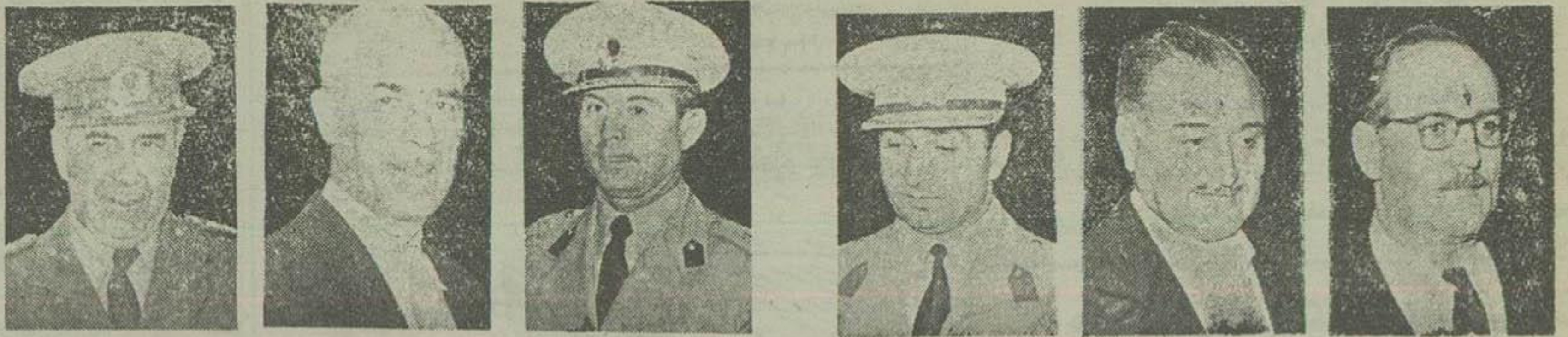
آقای زوداو وزیر خارجه، آقای فروزان تکیول مخبر کیسیون خارجه، سرتیپ کوالا کر سرتیپ آجودان رئیس جمهور، آقای آرزولیک رئیس آژانس اطلاعاتی، کلنل استیپن وابسته نظامی ترکیه در تهران، سرتیپ مصطفی طیار آجودان رئیس جمهور، آقای آرزولیک رئیس آژانس اطلاعاتی، سرتیپ کوالا کر سرتیپ آجودان رئیس جمهور، آقای فروزان تکیول مخبر کیسیون خارجه، آقای زوداو وزیر خارجه