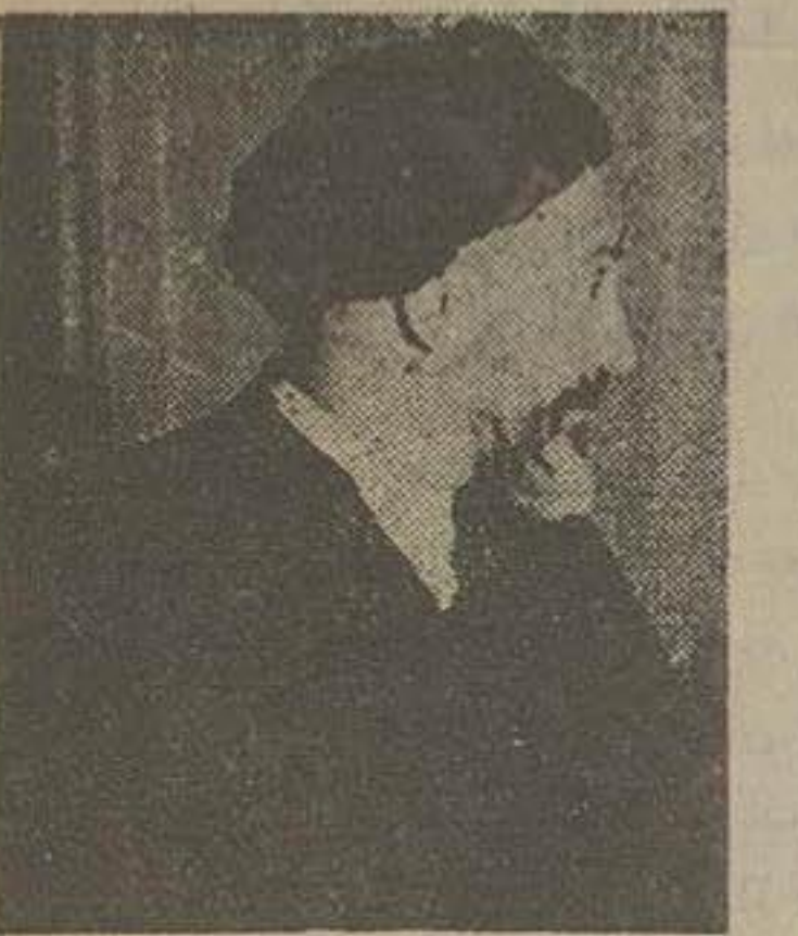
آقای دکتر امامی رئیس مجلس شورای ملی جریان استعفا را با اطلاع نمایندگان رسانید

جوها نسپورک - دیروز دکتر دادن رئیس کنگره هندیه های افریقای جنوبی از طرف حکومت ملان نخست وزیر آن کشور به ۶ سال زندان محکوم گردید رئیس ویدیر کنگره ملی افریقایان قسمت ترا سوال افریقای جنوبی نیز به زندان محکوم گردیده اند