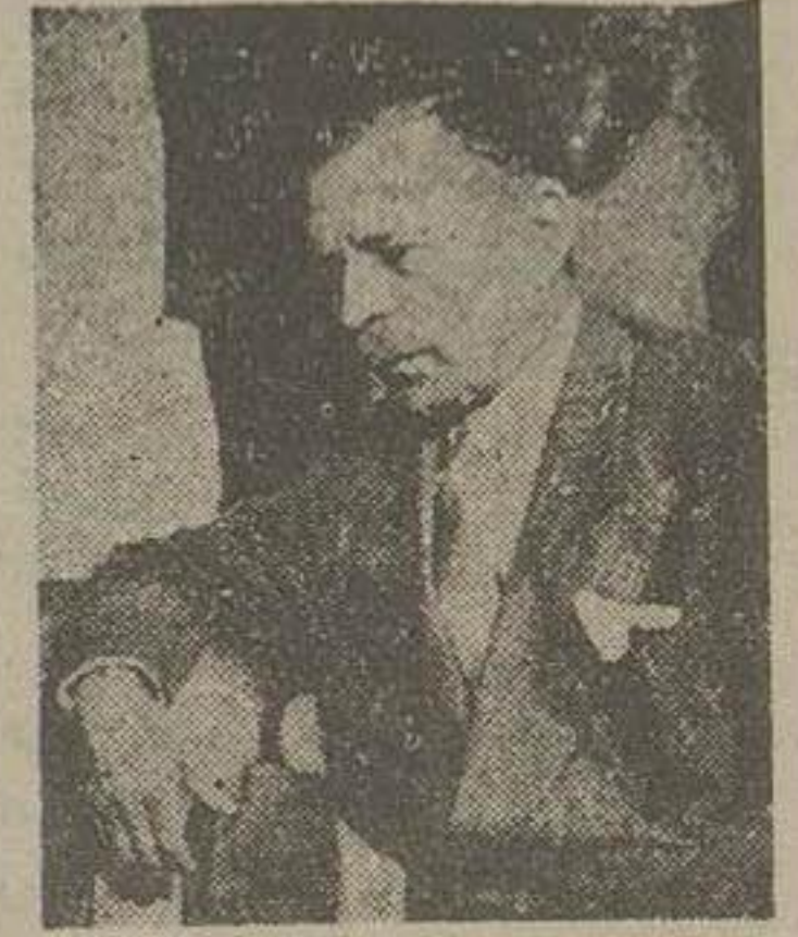
آقای علاء در ملاقات کوتاهی استعفا نامه را بر رئیس مجلس شورای ملی تسلیم کرد

«کسالت دارم استراحت کرده ام از ملاقات امروز مرا معذور دارید» کلومندان دفتر نخست وزیر که تا آن موقع معتقد بودند موضوع استعفاي نخست وزیر شایعه ای بیش نیست یقین کردند که آقای دکتر مصدق استعفا کرده و حاضر نیست مثل هر روز به امور جاری کشور رسیدگی نماید. در همان ساعت آقای علاء وزیر در بار متن استعفا نامه آقای نخست وزیر را بمجلس شورای ملی برد و آقای دکتر سید حسن امامی (امام جمعه) رئیس مجلس ارائه داد و قبولی آنرا از طرف اعلیحضرت همایونی اعلام داشت و نظر تمایل مجلس را نسبت به نخست وزیر آینده اعلام نمود.