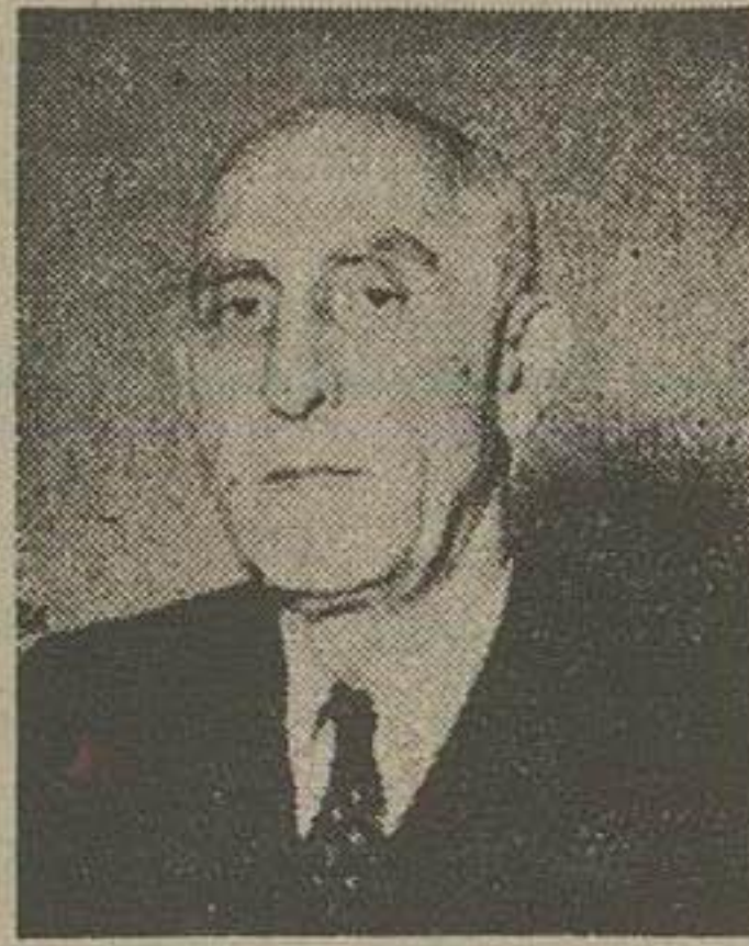
آقای دکتر مصدق استعفاي خود را دیشب بر سر اعلیحضرت همایونی رساند

آقای دکتر مصدق نخست وزیر دیروز پس از شرفیابی بحضور شاهانه و بازگشت از کاخ سعد آباد پس از مدتی مذاکره با بعضی از همکاران پارلمانی خود تصمیم خویش را با استعفا برداشت و چند ساعت بعد این تصمیم بصورت استعفا نامه روی کاغذ منعکس گردید و برای آقای علاء وزیر در بار ارسال شد تا بر سر اعلیحضرت همایونی برسد. از امروز با نهاد آ-آ-ای دکتر مصدق دست از کار شسته و در اطاق خویش استراحت کرده و از پذیرفتن اشخاص و حتی ارتباط تلفنی خودداری کرد صبح امروز هنگامیکه رئیس دفتر نخست وزیر حسب معمول اوراقی را برای ملاحظه و مطالعه نزد وی برد آقای دکتر مصدق که در تخت خواب استراحت کرده بود گفت: «من دیگر فرصت دیدن این کاغذ هارا ندارم»