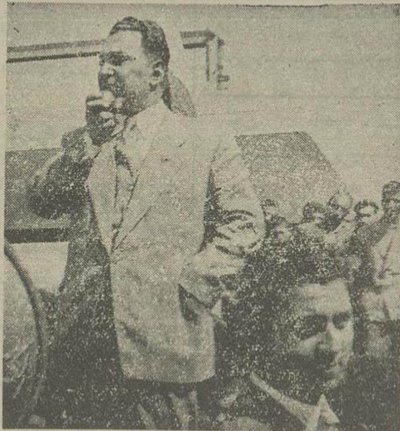
آقای دکتر سنجابی در فرودگاه مهرآباد در برابر جمعیت مستقبلی نطقی ایراد کرد