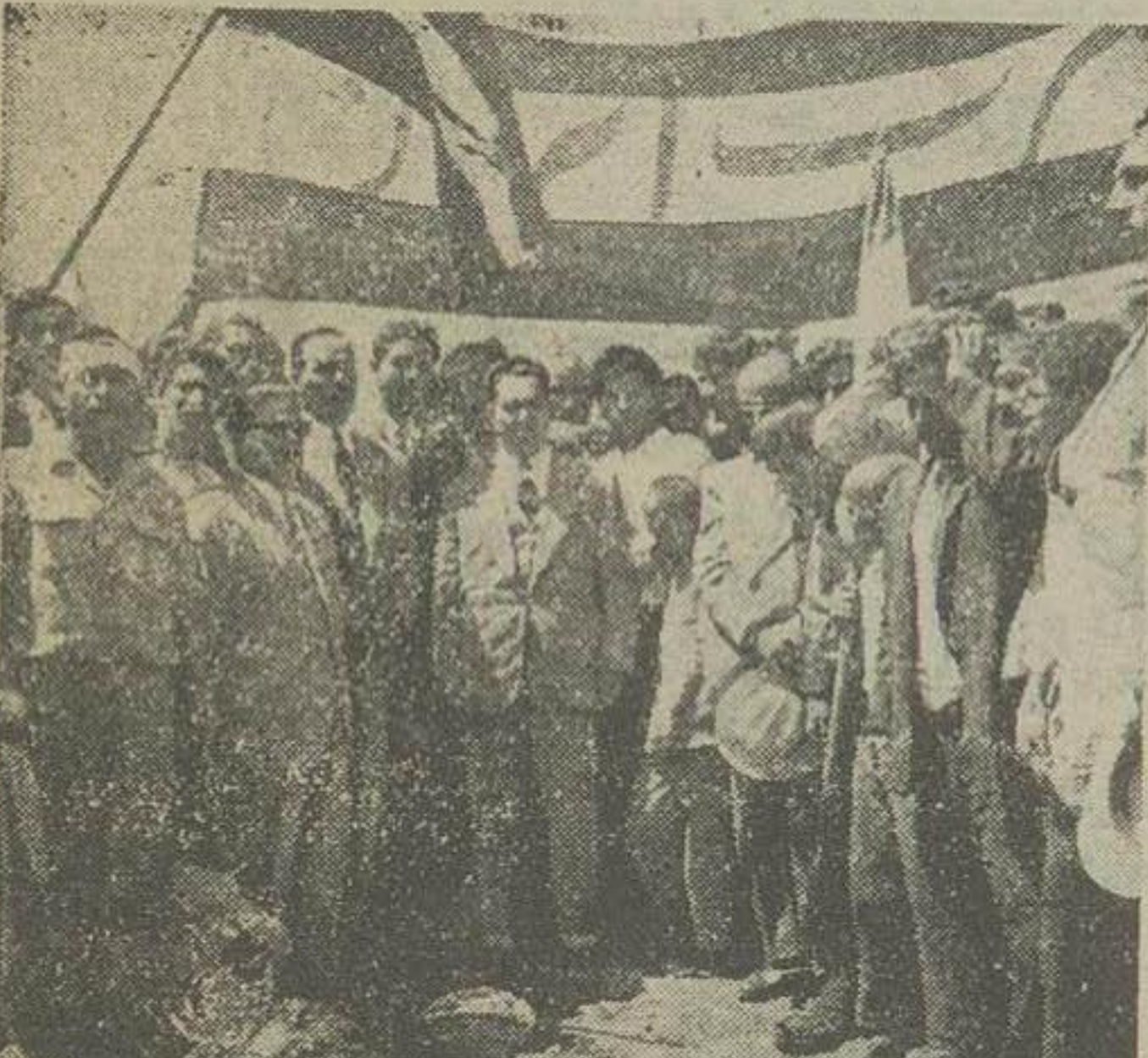
سپس در این بابویه دسته گلی بزار شهدای سی ام تیرماه نشان نمود

از ساعت هشت و نیم صبح عده زیادی از اعضای حزب ایران و بعضی از دستجات بقیه در صفحه پنجم